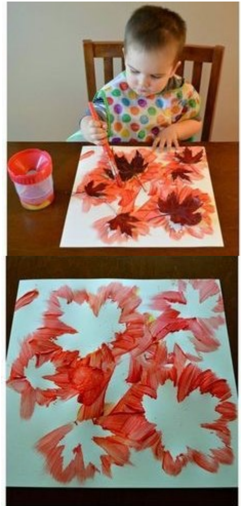
Abbildung 1 https://www.mission-mom.net/basteln-im-herbst-mit-kindern-von-naturmaterialien-bis-knoepfe/