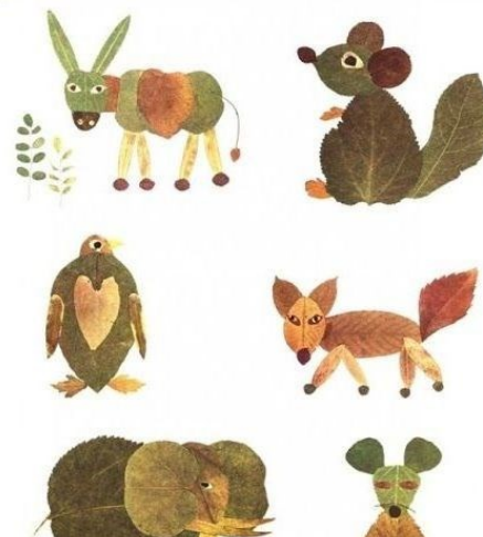
Abbildung 3 https://zenideen.com/deko-feiern/herbstblatter/